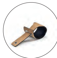
Chevillère cuir noir ou beige