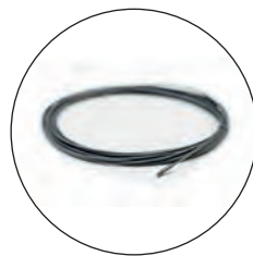
Câble 2 : 1