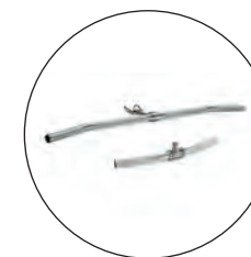
Barre de tirage Aluminium