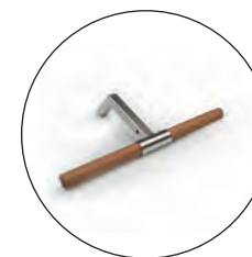
Barre de traction supplémentaire